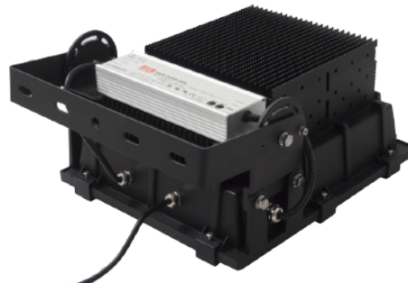
サージプロテクターを内蔵